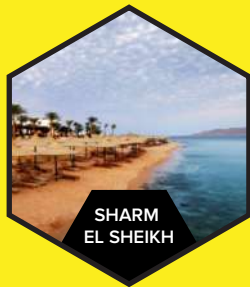
SHARM EL SHEIKH